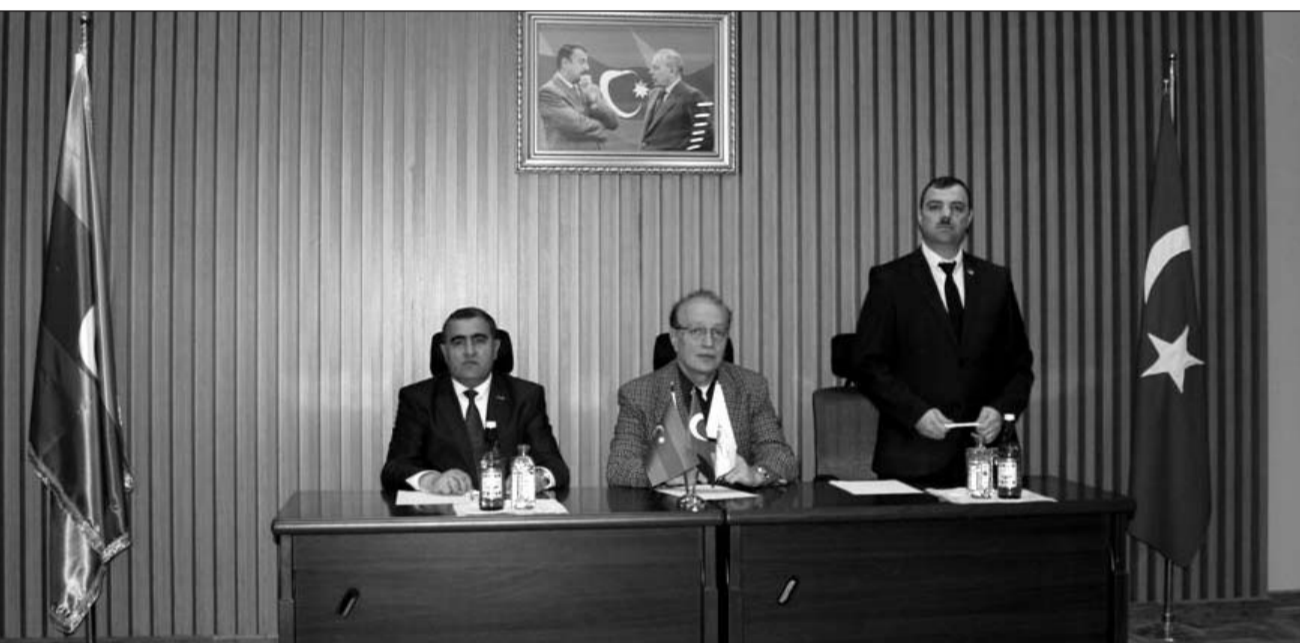
Ədalətli həmin qələbənin əldə olunmasına kömək məqsədilə minlərlə azərbaycanlının türk qardaşlarının